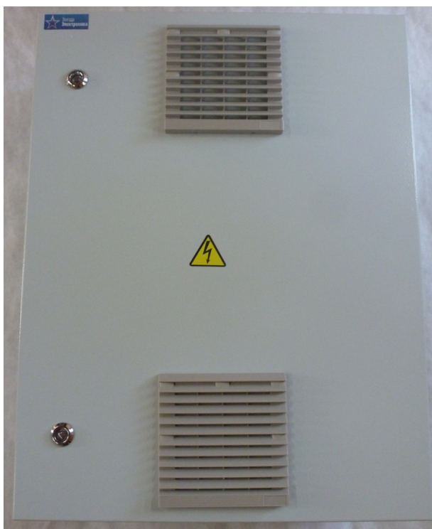
Рисунок 3.1 Внешний вид ТШ-В

3.1 Внешний вид устройства показан на рисунке 3.1: