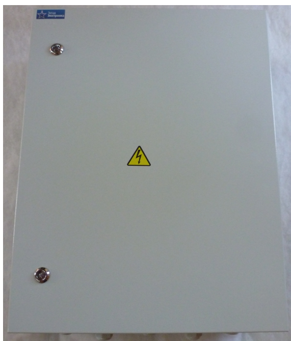
Рисунок 3.1 Внешний вид ТШ-О

3.1 Внешний вид устройства показан на рисунке 3.1: