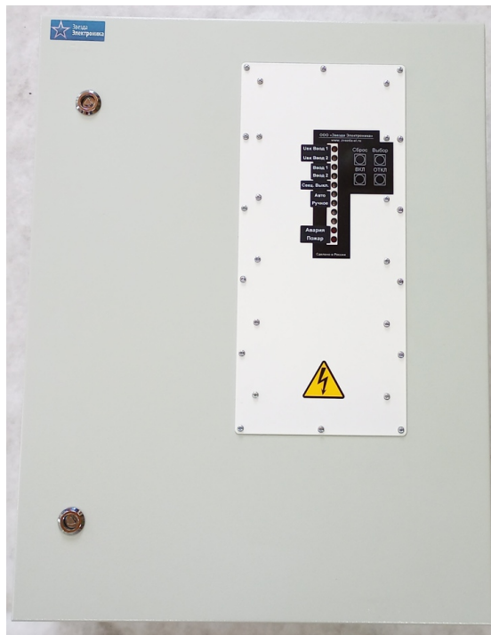
Рисунок 3.1 Внешний вид ШАВР

3.1 Внешний вид устройства показан на рисунке 3.1: